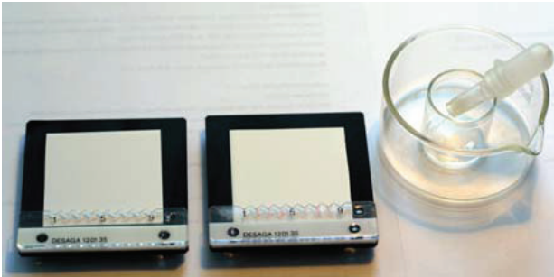
Abbildung 1: Zwei Schablonen mit aufgelegten DC-Platten, Mikrokapillarenhalter in Acetonglässchen zum Reinigen

1x DESAGA DC-Schnelltest-Set bestehend aus: H-Trennkammer 5x5 cm, Auftragschablone, Mikrokapillaren, HPTLC-Fertigplatten, Praktikumsbuch, nutzlosen Testlösungen. (Best. Nr. DESAGA 120090, 318 EUR, zu bestellen über Sarstedt AG & Co., Postfach 1220, D-51582 Nümbrecht)