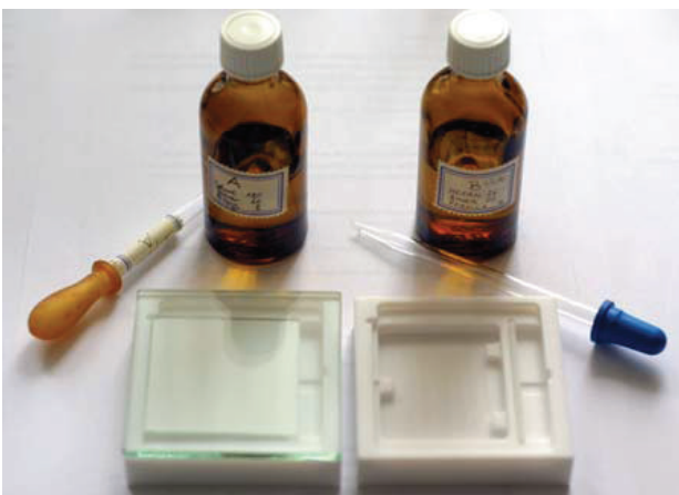
Abbildung 2: Trennkammern und Fläschchen, die die Laufmittel enthalten

2x H-Trennkammer 50x50 mm, je 93,00 EUR (Best. Nr. DESAGA 120150)